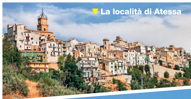
▼ La località di Atessa

A me è accaduto nell'inverno del 1975 quando, giovane ingegnere in percorso di formazione operativa, fui inviato nella sede di lavoro di Lanciano (CH) in Abruzzo del settore Reti. Il 27 novembre un'imponente nevicata proveniente dal mare investì il lancianese fino alla Maiella e, più pesantemente, i settori di Casoli ed Atessa.