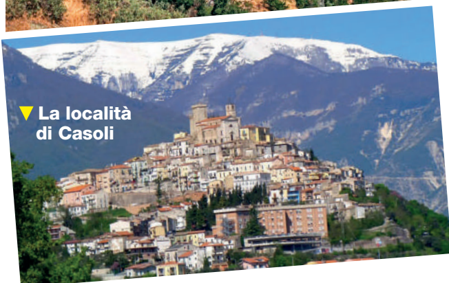
▼ La località di Casoli