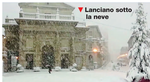
▼ Lanciano sotto la neve

Il peso della neve provocò danni molto consistenti alle reti dei servizi elettrici e telefonici; i tralicci di media ed alta tensione dell'ENEL furono contorti ed abbattuti, interrompendo l'erogazione dell'energia elettrica ; da parte nostra avemmo molte centrali e i due citati settori isolati elettricamente e telefonicamente tra di loro e dal Centro Distretto di Lanciano ; dal punto di vista dell'utenza, trattandosi di zone a densità edilizia molto distribuita e prevalentemente servita da cavetto autoportante su palificazione, i danni furono estremamente pesanti con migliaia di collegamenti interrotti privati ed affari (come si diceva allora, adesso business).