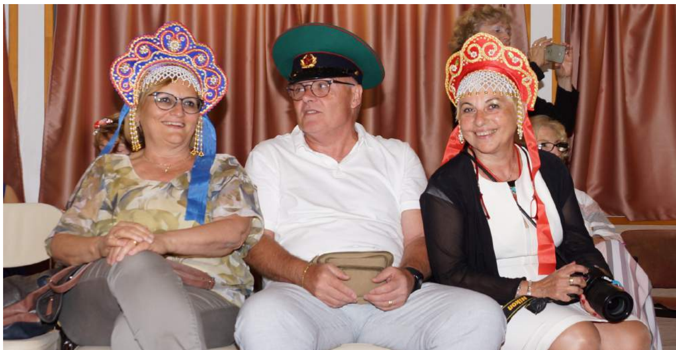
■ Più Russi di così!