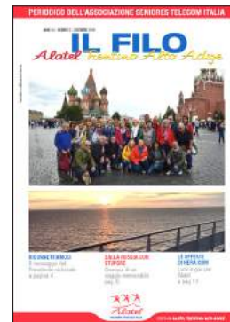
In copertina: Immagini del viaggio in Russia 2019