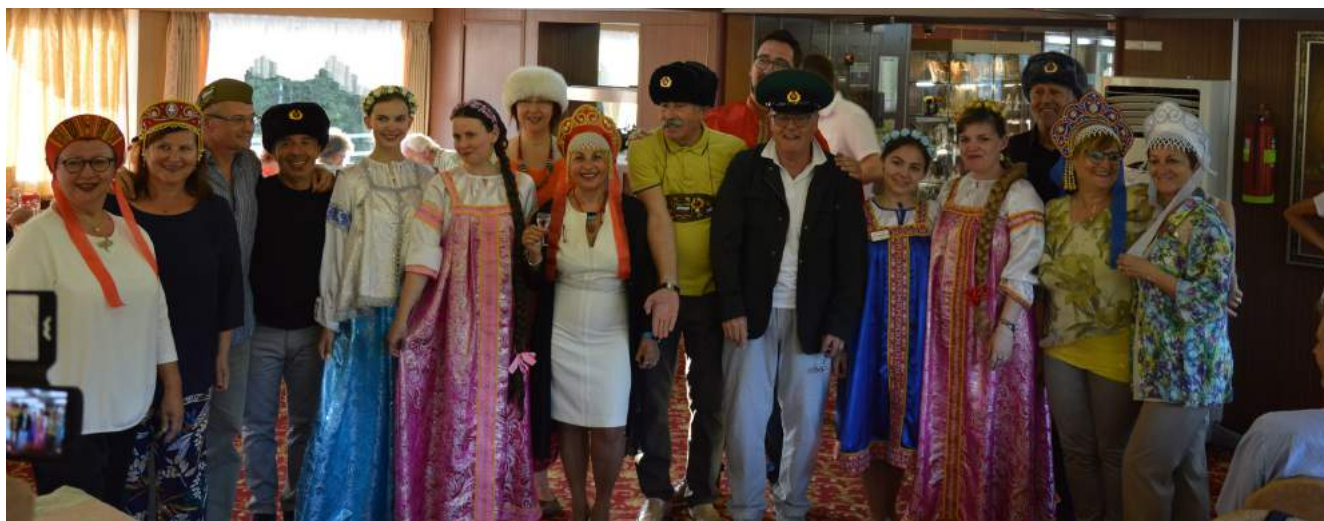
■ La nostra "Festa Russa"