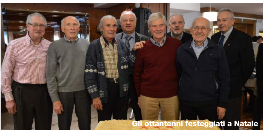
Gli ottantenni festeggiati a Natale

C hiosa l'esperienza pugliese ci siamo ancora ritrovati per un Törggelle il 17 ottobre in Val Ridanna a Monteneve presso l'Hotel Schneeberg in una bella giornata di sole. Abbiamo visitato il Museo di caccia e pesca di Castel Wolfsthurm e nel pomeriggio le Miniere di Ridanna Monteneve dove non sembra di trovarsi in un museo, ma a contatto con la vita dei minatori e con la storia delle miniere. La catena di produzione, dall'estrazione del minerale, al trasporto fino alla sua lavorazione, è stata pienamente conservata. Anzi: la miniera e tutti i suoi sistemi sono ancora totalmente operativi, e la produzione potrebbe anche essere ripresa in qualsiasi momento!