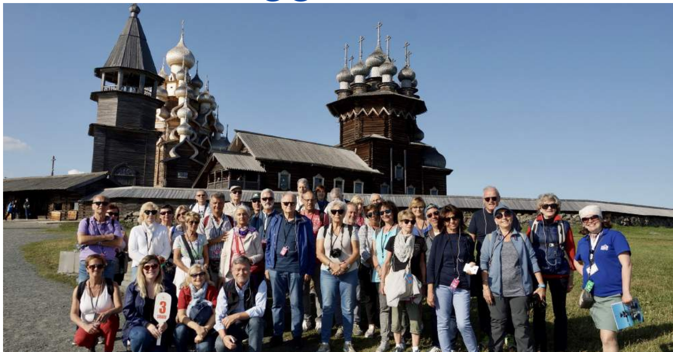
■ Isola Kizhi