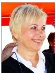
a cura di Anna Stevanato

Quattordici giorni di tour indimenticabili tra le bellezze della natura e dell'arte russa e il divertimento della nostra allegra compagnia.