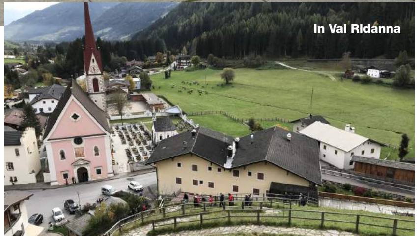
In Val Ridanna

C hiosa l'esperienza pugliese ci siamo ancora ritrovati per un Törggelle il 17 ottobre in Val Ridanna a Monteneve presso l'Hotel Schneeberg in una bella giornata di sole. Abbiamo visitato il Museo di caccia e pesca di Castel Wolfsthurm e nel pomeriggio le Miniere di Ridanna Monteneve dove non sembra di trovarsi in un museo, ma a contatto con la vita dei minatori e con la storia delle miniere. La catena di produzione, dall'estrazione del minerale, al trasporto fino alla sua lavorazione, è stata pienamente conservata. Anzi: la miniera e tutti i suoi sistemi sono ancora totalmente operativi, e la produzione potrebbe anche essere ripresa in qualsiasi momento!