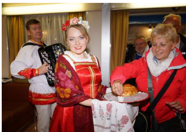
■ Ricevimento sulla nave