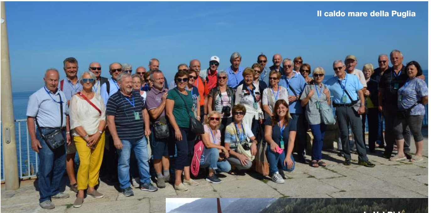
Il caldo mare della Puglia

se antiche, archetti, botteghe artigiane ci parlano di tradizioni ancora vive, di un'atmosfera genuina che resiste alle tentazioni della modernità. Il suo centro storico è interamente visitabile a piedi e regala emozioni a non finire. Gli scorci pittoreschi, i numerosi balconi fioriti e le vedute panoramiche incantano e dilatano il tempo come per magia. Case bianche, scalini per salire in casa, fiori ovunque, viottoli in cui non ti stanchi di girare si trovano anche a Cisternino. Paesi in cui veramente sembra che il tempo si sia fermato. Ultima tappa pugliese Trani con la sua cattedrale sul mare e uno scenario splendido. E poi.... dovevate esserci! Cibo e compagnia ottimi....e come alla fine di ogni viaggio ci accorgiamo di avere creato nuove amicizie, conosciuto meglio le persone e ciò è sempre un'ulteriore appagante esperienza.