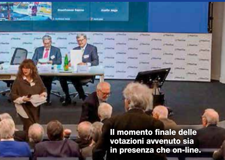
Il momento finale delle votazioni avvenuto sia in presenza che on-line.